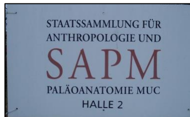
Eingang zur Osteothek in Poing.

Der 2. Workshop des Archäozoologenverbands fand am Freitag den 28. November 2014 in München statt. Diesmal stand das Thema „Greifvögel“ auf dem Programmplan. Hierzu besuchten wir die osteologische Vergleichssammlung (Osteothek) der SAPM (Staatssammlung für Anthropologie und Paläoanatomie) in Poing.